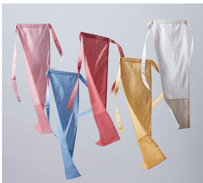
THE FUNDOSHI™ with good sleep