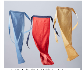
お得！免疫力は落とせない 秋の快眠3枚セット