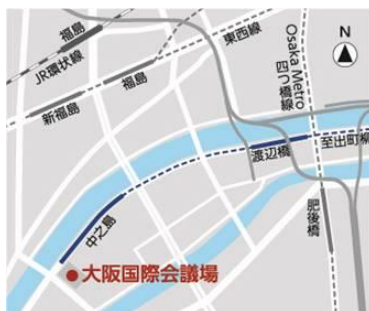
大阪国際会議場へのアクセス