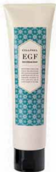
バイオクリーム ソープ