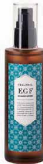
バイオモイスト ローション