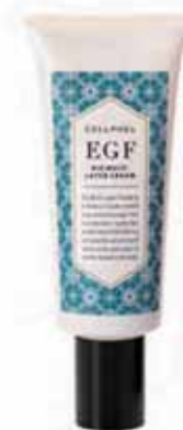
バイオマルチ レイヤークリーム