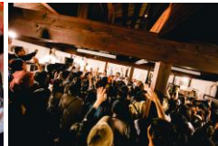
高岡クラフト市場街