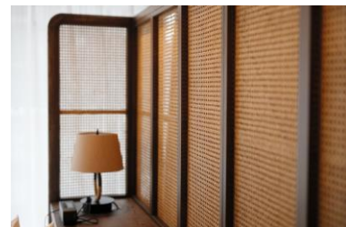
日本建築の要素を取り入れた客室