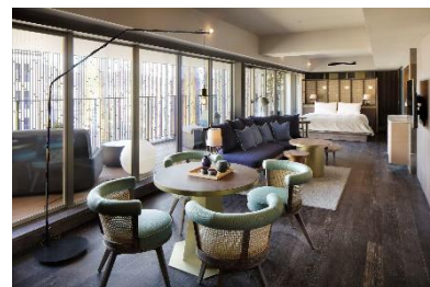
自然を感じられる客室