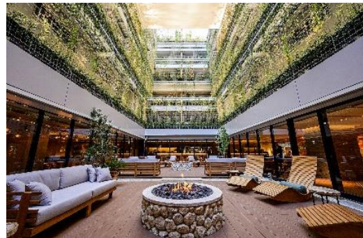
GOOD NATURE HOTEL KYOTO 4階 中庭

「GOOD NATURE HOTEL KYOTO」は、京都・四条河原町の複合型商業施設「GOOD NATURE STATION」の4～9階を占め、心と体の心地よさを追求しつつ、地球環境にも配慮したライフスタイル体现型ホテルです。今回の認証取得にあたっては、認証システムのメンテナンスを行う公益企業のIWBI(※)、設計施行者である株式会社大林組とともに、100項目以上におよぶホテル版の評価基準を独自に策定しました。そのうち