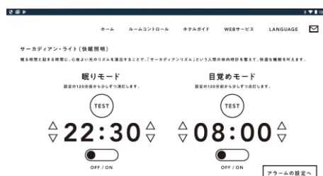
快適な眠りをもたらす快眠照明の操作画面