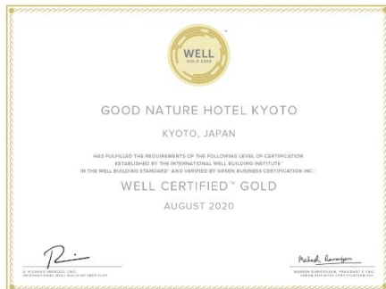
WELL Building Standard™ 認証状

株式会社ビオスタイル（本社：京都市下京区、社長：三浦達也）が2019年12月にオープンした「GOOD NATURE HOTEL KYOTO」は、2020年8月6日に環境や健康に配慮した建物が認定される「WELL Building Standard™（以下WELL認証）」をゴールドランクで取得いたしました。 ホテル版評価基準によるWELL認証(v1)の取得は、当ホテルが世界で初めてとなります。