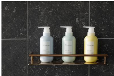
バスアメニティにはオリジナルオーガ ニックブランド「NEMOHAMO」を使用