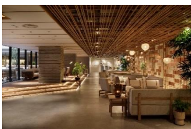
京都の奥座敷・貴船をイメージしてデザインされた4階ロビー

客室を含むホテルの内部空間などに地域環境に根差したデザインを施し、日本らしさ・京都らしさを表現。地域の景観条例にも準拠。