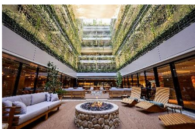
京都の植生を再現した大緑化壁

宿泊客以外でもアクセスできる中庭に、京都の植生を再現したテイカカズラの「大緑化壁」やWELL認証の要件である水景に代わる「枯山水」を設置し、京都きっての繁華街・四条河原町にありながら緑や自然に囲まれて過ごせる空間を実現。