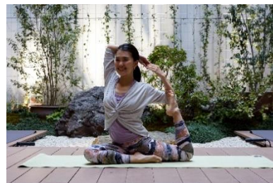
ホテルゲスト限定で提供しているヨガや 瞑想をはじめとしたウェルネスプログラム