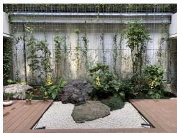
水景に代わる枯山水