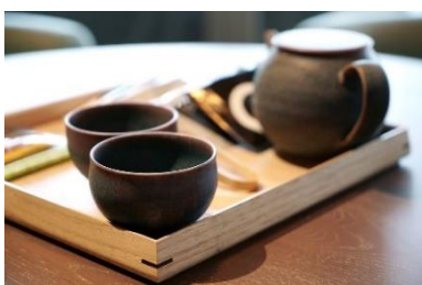
京都・清水焼の茶器を用いた 客室アメニティ

「GOOD NATURE」に触れるホテルゲスト向け館内外体験ツアーの提供や、健康への意識づけを高めるオリジナルアメニティの設置など。