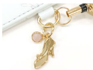
ローズクォーツとガラスの靴のチャーム付き。