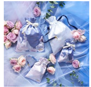
ココニストらしいバラとシンデレラのアイテムも展開。