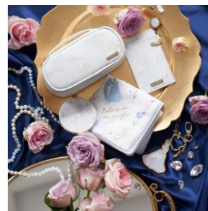
今回発売するアイテムの中で、ハンカチにだけは王子が登場！