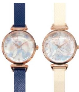
秒針にガラスの靴のイラストがあらわれた腕時計も 2 パターンご用意。

株式会社サザビーリーグが“Relax&Happiness”をテーマに展開するブランド『Cocoonist (ココニスト)』から、今年ディズニー映画公開 70 周年を迎える「シンデレラ」のアイテムが 9 月 17 日(木)より登場いたします。シンデレラが舞踏会で恋に落ちた瞬間に、お城がピンク色に染まるシーンからインスピレーションを受け、水色からピンクのグラデーションや、大人女子でも持ちやすいネイビーを基調としたアイテムを中心に展開。ポーチやパステースには、恋のお守りのローズクォーツやガラスの靴がついており、大人女子の恋を応援するアイテムが揃います。