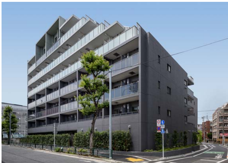
【 ガーラ・プレシャス練馬 】