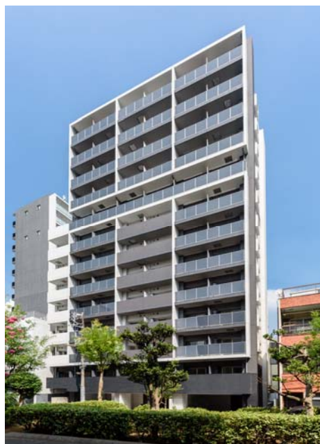
【 ガーラ・アヴェニュー木場 】