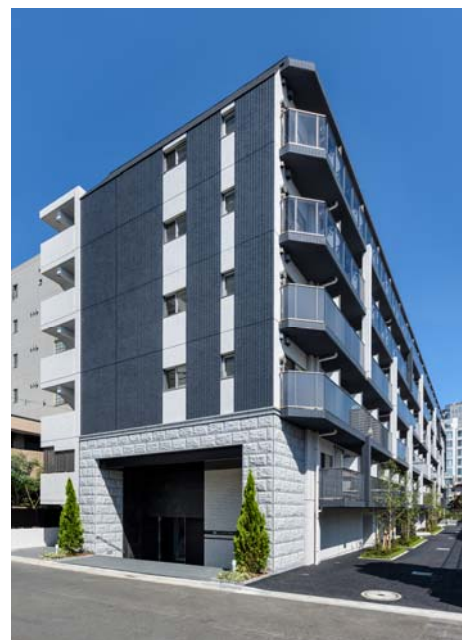
【 ガーラ・グランディ川崎西口 】