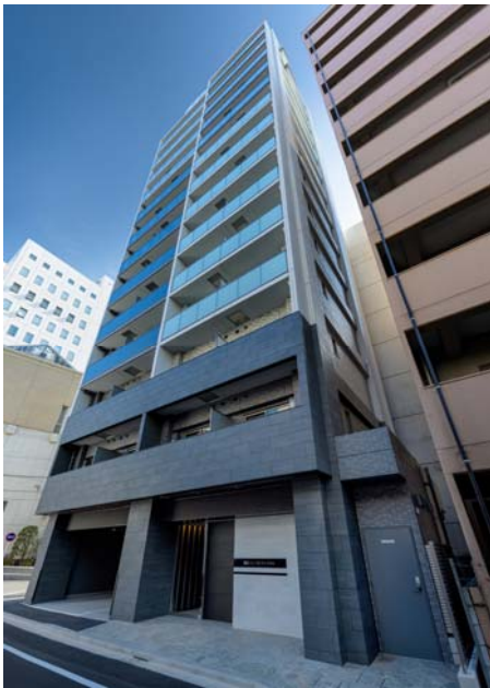
【ガーラ・プレシャス高輪台】

当社は、今後も上質なデザインを追求した外観やエントランス、安全性・快適性を重視した設備仕様など、居住者目線に立ったマンションの企画・開発を進めていきます。