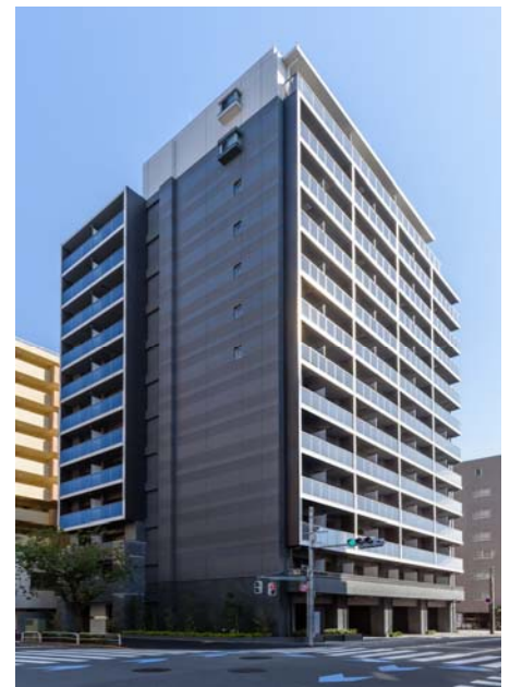
【ガーラ・プレシャス大森】