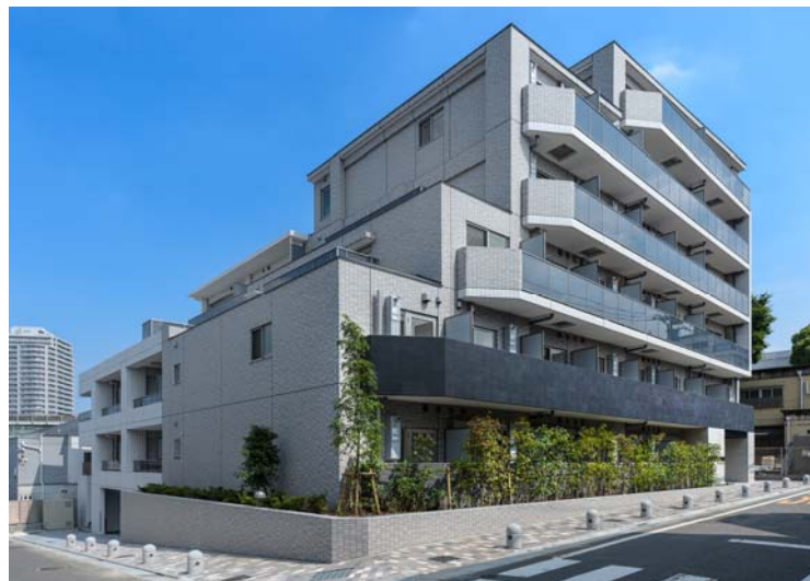
【 ガーラ・ヒルズ品川下神明 】