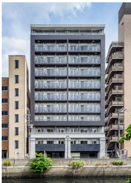
【 ガーラ・リバーサイド横濱南 】