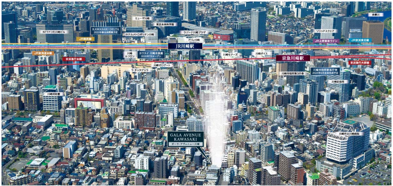
【現地上空からの航空写真】