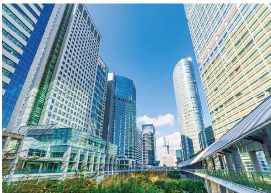
【品川インターシティ・品川グランドcommons】