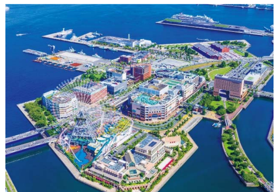
【横浜みなとみらい21】