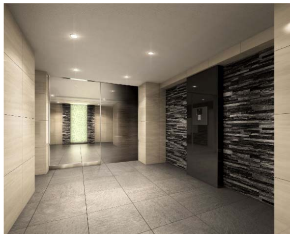
【エントランスホールイメージ】