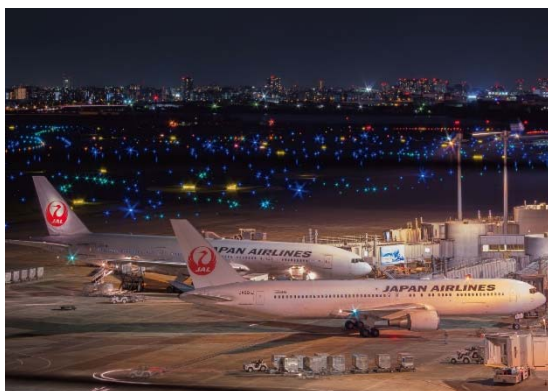
【羽田空港(東京国際空港)】