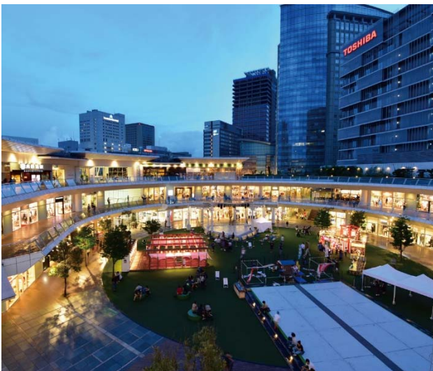
【ラゾーナ川崎プラザ】