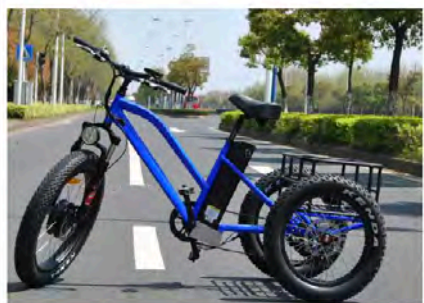
i trike 706型