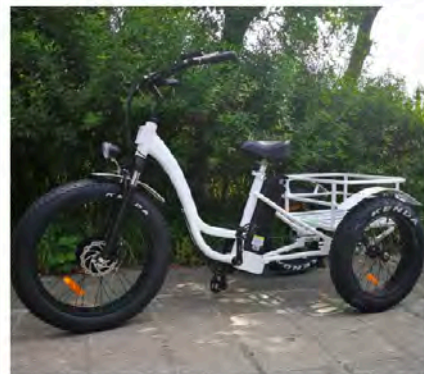
i trike 708型