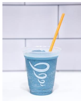
「ソライロ・コージー」 (sorairo cozy)