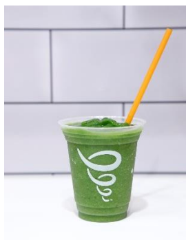
「アップルグリーズ」 (apple 'n greens™)