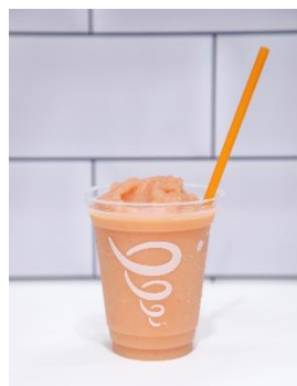
「カリビアンパッション」 (caribbean passion®)