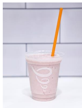
「ソイプロテイン・ベリーワークアウト」 (protein berry workout™ with soy protein)