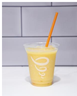
「マンゴー・ア・ゴーゴー」 (mango-a-go-go®)