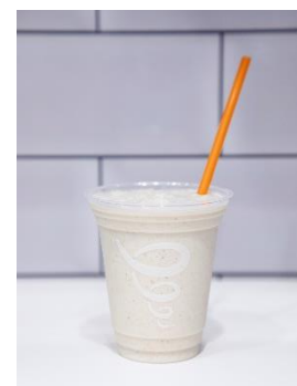
「ピービー・バナナプロテイン」 (pb & banana protein)