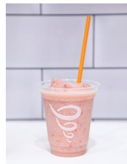
「ストロベリーズワイルド」 (strawberries wild®)