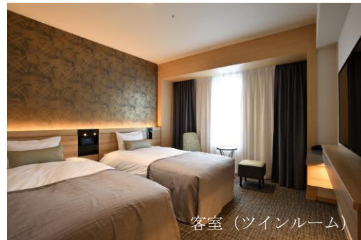
客室 (ツインルーム)

仙台の象徴であるケヤキ並木で有名な青葉通りに面し、ビジネス利用はもちろん、東北各地への観光の拠点としてもご利用いただけます。仙台駅や仙台空港からのアクセスも良く、仙台への訪問が初めての方の利用にも最適です。