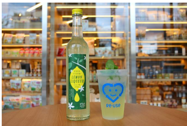
京都伏見レモンリキュール (左) /レモンサワー(右)

期間中は当施設 1 階の MARKET KITCHEN オリジナルレモンリキュールのボトルとレモンサワーを販売いたします。原料は伏見区にて農薬不使用で育てられたレモンに、アガベシロップを使用。美味しく、地球環境にも優しいオリジナルのドリンクを提供いたします。