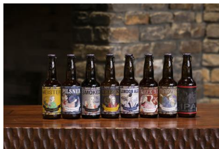
丹後王国ブルワリー

※都合により一部内容・営業時間を変更する場合がございます。最新の情報は GOOD NATURE STATION 公式ホームページ( https://goodnaturestation.com/ )でご案内いたします