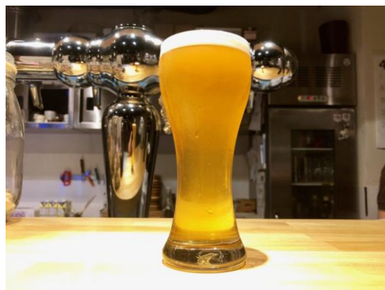
一乗寺ブリュワリー