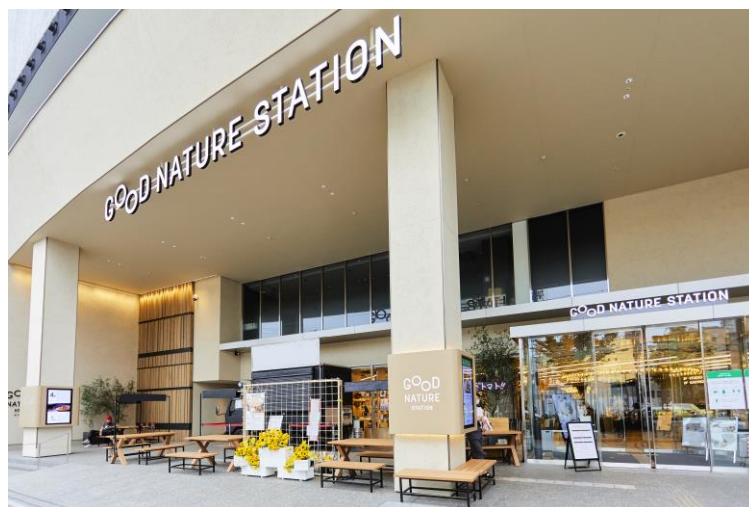
GOOD NATURE STATION1階 MAENIWA

GOOD NATURE STATION 1階のピロティ。京都の主要な通りのひとつである河原町通に面しており、週末を中心に当施設と関わりの深い生産者による野菜の直売、収穫体験のほかキッチンカーによる飲食メニューの販売などを行っています。