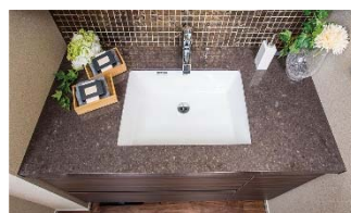
【ボウラー体型洗面化粧台】