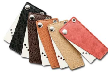
【カードキーイメージ】