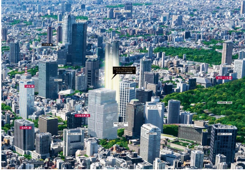
【現地上空からの航空写真】

「ガーラ・プレシャス赤坂見附」が位置するエリアは、都心の中でも際立ったブランド力を誇る地域です。行政や経済の中心地に近く、交通便利性が秀逸といったメリットに加え、地盤が安定しているとされる武蔵野台地に立地する特性も注目され、人気を集めています。