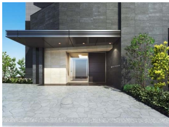
【エントランスイメージ】