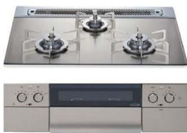
【Siセンサー付き3口ガスコンロ】