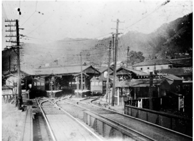
②開業当時の阪急神戸本線の終点神戸(上筒井)駅