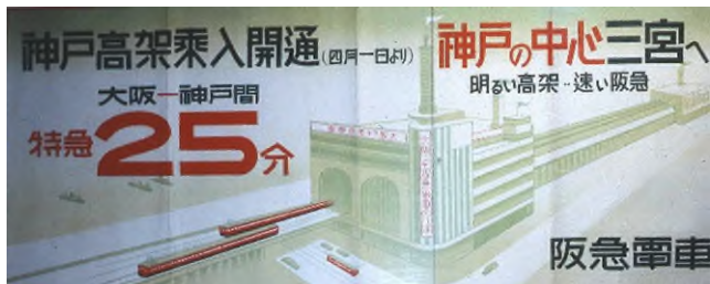
③神戸市内高架線開通ポスター(1936年)