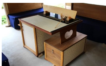
点茶台「八峯卓(はっぽうたく)」