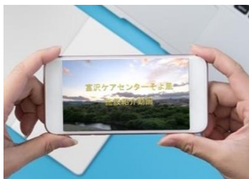
パソコンやスマホで「富沢ケアセンターそよ風」の館内を動画で見ることができます

さらに、自宅にこもる時間が増えることで筋力や骨が弱くなりがちになることから、たんぱく質とカルシウムを強化した夕食用の持ち帰り用弁当をご用意しています。