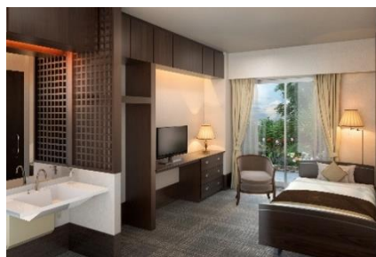
「ケアプラスホテル 市川ステイ」居室(一例)