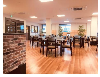
「富沢ケアセンターそよ風」デイサービスフロア