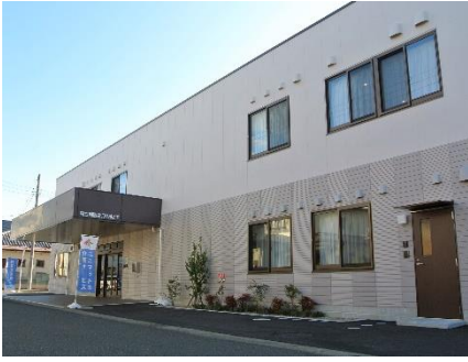
6/1 開設「富沢ケアセンターそよ風」外観