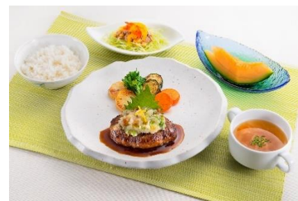
「ケアプラスホテル」昼食(一例)