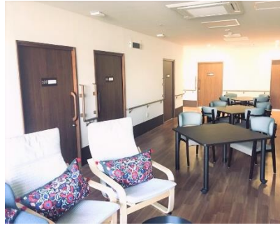
「富沢ケアセンターそよ風」ショートステイフロア