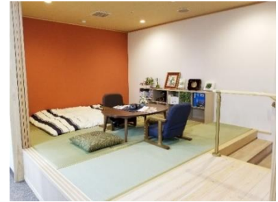
4/1 開設 認知症対応型デイサービス「そよ風エミテラス くまもと」静養室

4月1日開設した「そよ風エミテラス くまもと」は、当社における認知症対応型デイサービスの新ブランド『そよ風エミテラス』の第一号で、既存のグループホームおよびデイサービス、居宅介護支援を有する複合施設「くまもとケアセンターそよ風」に新たなサービスとして加設しました。