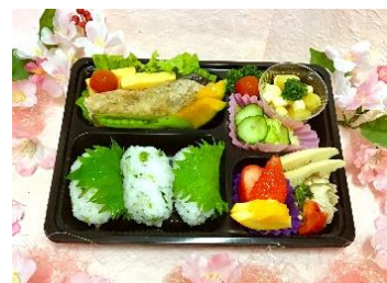
「富沢ケアセンターそよ風」免疫力UP 弁当(一例)