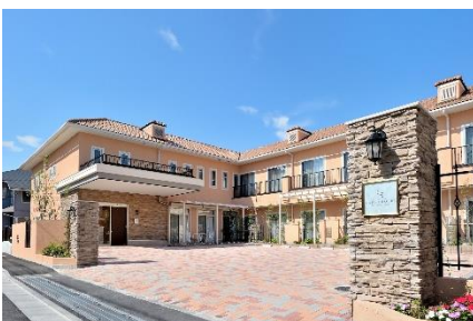
5/1 開設「ケアプラスホテル 市川ステイ」外観

さらに、滞在中の身体機能の維持および向上を図る個別プログラムや気軽に参加できるリハビリ体操や運動プログラム、滞在時間をより有意義にするレクリエーションや歌舞伎鑑賞、東京湾クルージングなど、季節ごとにイベントを開催。食は楽しみが深まるよう、季節の移り変わりを感じるメニューをはじめ、和食・洋食ともにバラエティ豊かなメニューをご用意。施設の厨房で調理した出来たての温かくおいしい食事を提供いたします。