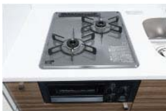
【Siセンサー付き2口ガスコンロ】