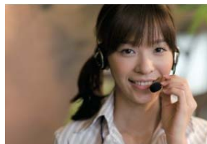
【ガーラコンシェルジュサービスイメージ】

■ご入居者様専用の相談窓口「ガーラコンシェルジュサービス」は、家賃・修理・更新・退室などの相談から、暮らしをサポートするためのフロントサービスも行います。 ■全ての専有部に快適なインターネット接続環境（住戸内最大1Gbps）を提供します。無線LAN環境でもインターネットをご利用いただけます。