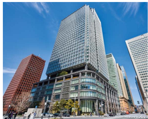
【新丸の内ビルディング】