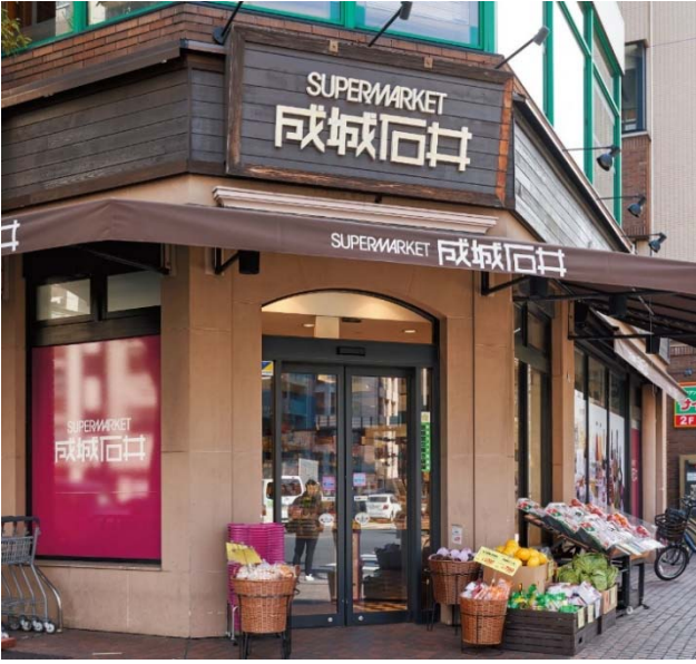
【成城石井 日本橋浜町店】