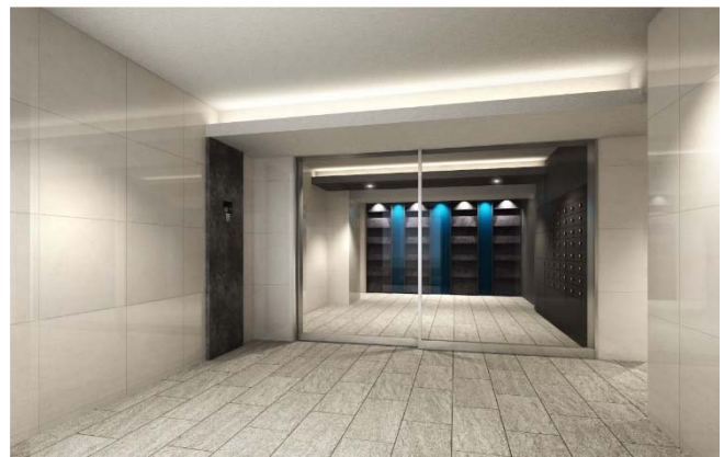
【エントランスホールイメージ】