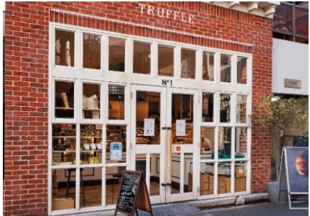
【トリュフペーカリー本店】