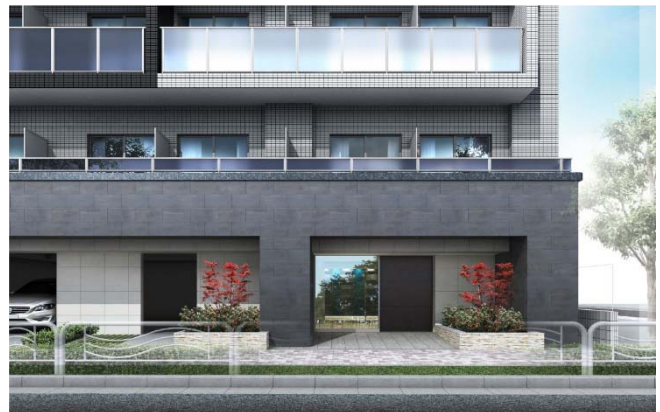
【エントランスイメージ】