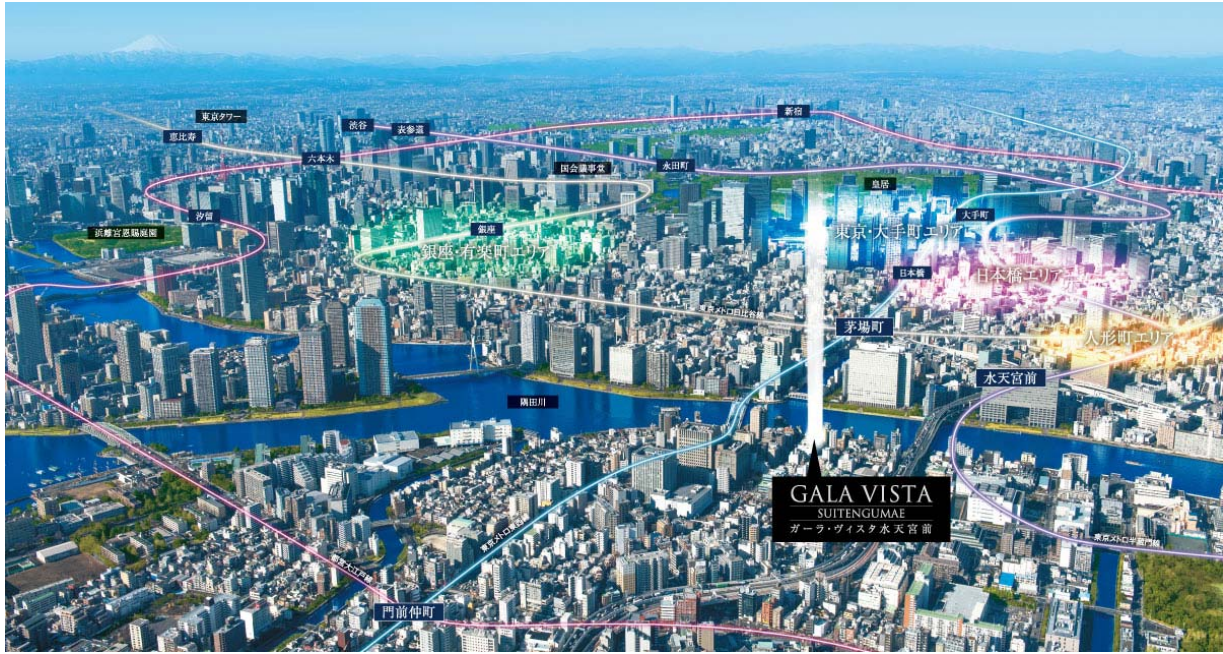
【現地上空からの航空写真】