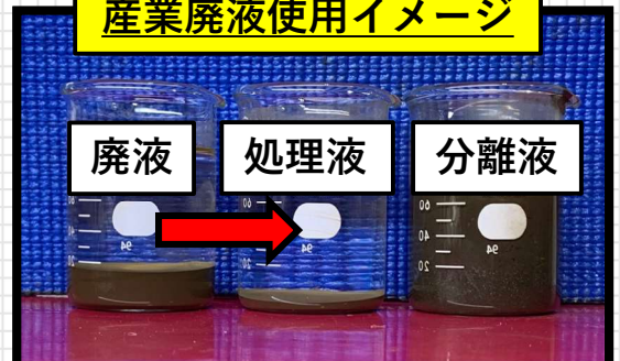
産業廃液使用イメージ