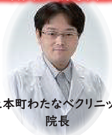
上本町わたなべクリニック 院長