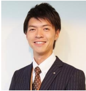
日本PCサービス株式会社 ビジネスソリューション事業本部 取締役兼本部長