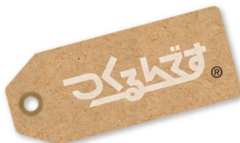
つくるんです®のロゴ

同梱されている日本語説明書の通りに作っても、パーツの色を塗り替える・布を張り替えるなど、自分好みにカスタマイズ可能なため“アイデア一つで世界に一つ”を作ることが出来ます。また、完成したあとはインテリアとしてもお楽しみいただけます。