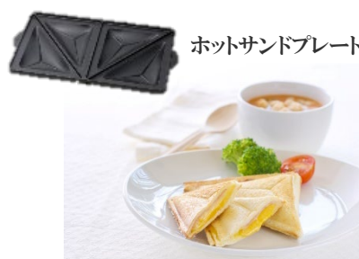
ホットサンドプレート