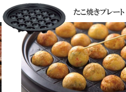
たこ焼きプレート