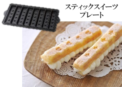
スティックスイーツ プレート