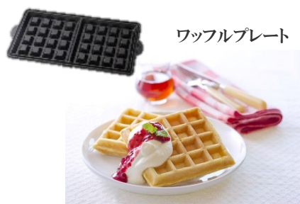
ワッフルプレート