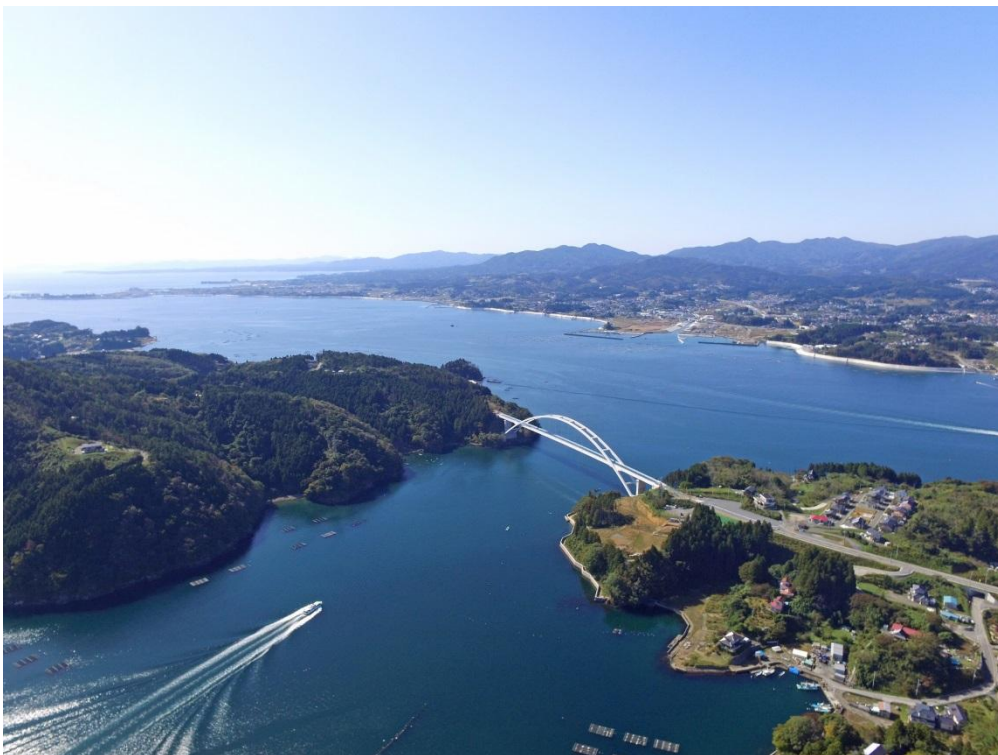
空から見た気仙沼大島

休暇村気仙沼大島は3階建てで、広さ55㎡以上のプレミアム和洋室を含めた全33室の客室とレストラン、大浴場、売店、ブックラウンジのシンプルな構成です。「気仙沼の自然、食、文化を楽しむ」をコンセプトに、空を見上げられるオープンエアバルコニー、中庭には縁側と暖炉を用意し、自然の移りを愉しめながらおくつろぎいただけるスペースを設けました。