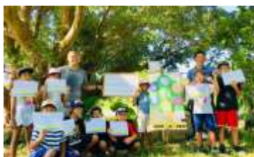
西表島の子ども達に環境について学ぶ機会を

自然環境や文化的資源を地域住民とともに保全することで、観光業を始めとする産業が活発化し、地域経済にとっても良い循環が生まれ、それが住民に還元されていく。守り受け継ぐべき事を守り、時代と共に進化をしながら、環境問題や文化継承に取り組む団体です。地域住民への自然環境保全、文化伝承などの啓蒙活動や、ビーチクリーンを定期的に行う。ビーチクリーンでは、多くの地域住民と共に、海流に乗って漂着した多くのペットボトルや発泡スチロールなどのゴミを「八重山環境ネットワーク西表エコプロジェクト」と協働で回収。ビーチの環境整備を行っています。