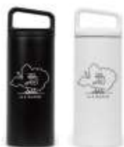
マイボトル 4,500円(税別) 2色展開

イラストレーター・長場雄が手掛けるキービジュアルを配したチャリティグッズを制作。売り上げの一部がUs 4 IRIOMOTEに活用されます。2019年4月下旬よりKEEN オフィシャルサイトおよびSORA 石垣店にて販売。(取扱い店は増える可能性があります)