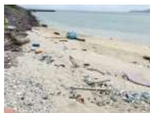
西表島の海岸には、多くの漂着ゴミが