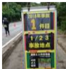
交通事故が起きた場所にはこのような看板がある