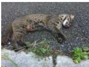
交通事故の被害に遭ったイリオモテヤマネコ

「やまねこパトロール」は、野生動物保護のために活動するNPO「JTEFトラ・ゾウ保護基金」の西表島支部とし活動を展開。イリオモテヤマネコを事故から守るため夜間パトロールを実施し、ドライバーへの注意喚起やヤマネコが路上に餌付く原因となる小動物の死骸除去など、地道な活動を行っています。