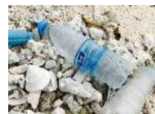
ペットボトルや、プラスチックゴミが大部分を占める