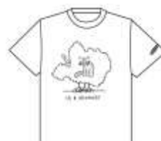
Tシャツ 3,500円(税別) 5イラスト ホワイト・ブラック・オリーブ 3色展開