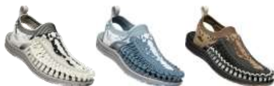
UNEEK EVO “IRIOMOTE” パック (13,000円/税別)

イリオモテヤマネコの柄をモチーフにした“IRIOMOTE”パックの売り上げの10%をUs 4 IRIOMOTEに活用いたします。