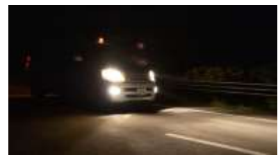
やまねこパトロールが行っている夜間パトロール