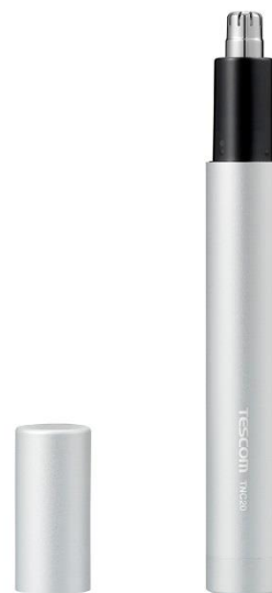
<S:アルマイトシルバー>

製品名：エチケットカッター 品番：TNC20 発売日：2020年4月下旬 販売先：全国の家電量販店など 価格：オープン 市場想定価格 ¥1,980(税抜) * 価格を表記する際は「編集部調べ」とご記載ください。 カラー：(S)アルマイトシルバー