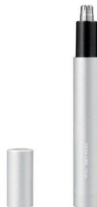
<S:アルマイトシルバー>