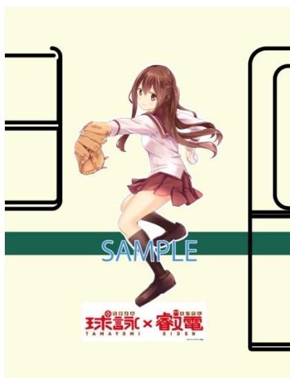
ラッピングイメージ