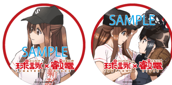
ヘッドマークのイメージ