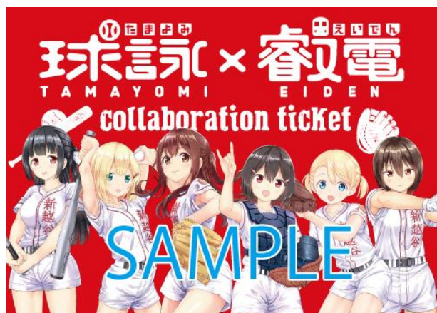
コラボきっぷのイメージ