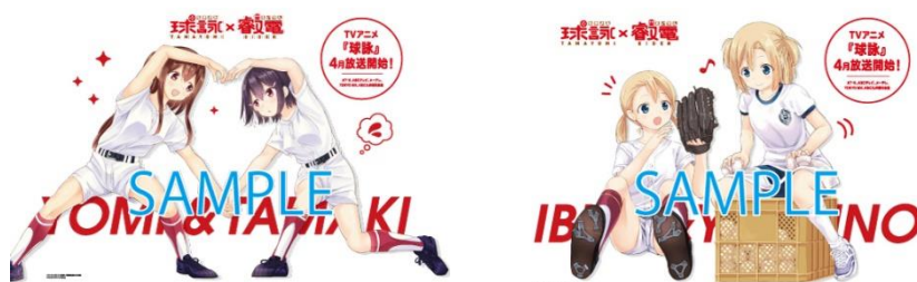
車内ラッピングのイメージ