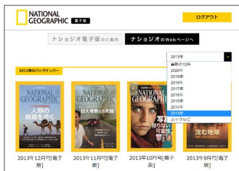
電子版バックナンバー

2020年4月1日から定期購読者（年間購読または電子版月額購読）[注]の皆様への新サービスとして、最新号に加えて、2013年3月号からの過去7年分の電子版のバックナンバーをお読みいただけます。また2020年4月号以降は特集記事を、HTML形式で掲載しますので、スマホでも雑誌記事が読みやすくなります。