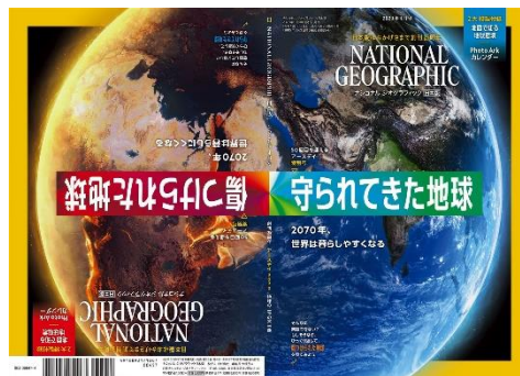
2020年4月号 創刊25周年記念号

■通巻300号 2020年3月号 <創刊300号記念 特製付録> 特別定価：1210円（税込）