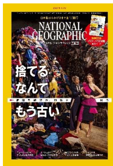
2020年3月号 創刊300記念号