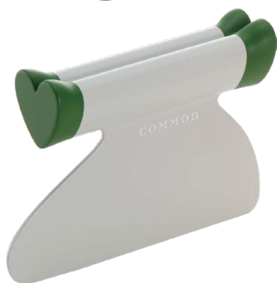
TEA GREEN ティーグリーン