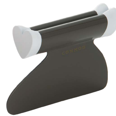
MILKY WHITE ミルキーホワイト