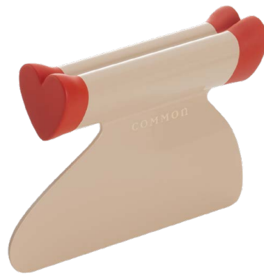
COMMON ORANGE カマンオレンジ