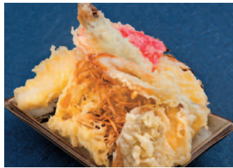
天ぷら1皿のせ放題 580円