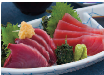
近海まぐろとかつを 刺身定食 1,280円