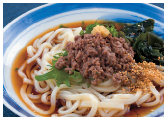
夢咲牛そぼろそば・うどん (温・冷) 各800円