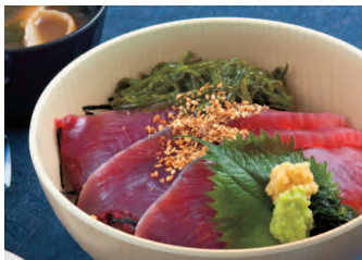
近海上まぐろとかつをの めかぶ丼 1,100円