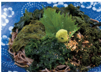
御前崎磯づくしそば・うどん (温・冷) 各850円