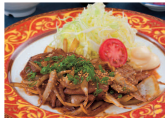
遠州黒豚コク旨焼肉定食 1,000円