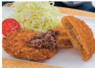
夢咲牛2種類のカツ定食 1,100円