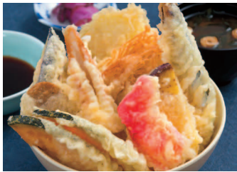
天ぷらのせ放題天丼 880円