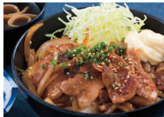
遠州黒豚コク旨ポーク丼 980円