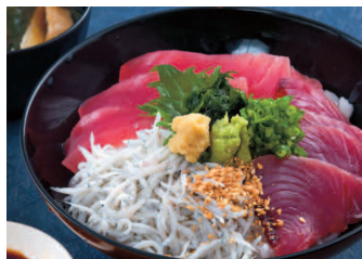
御前崎たわら屋特選丼 (鯖・鯉・しらす) 1,380円