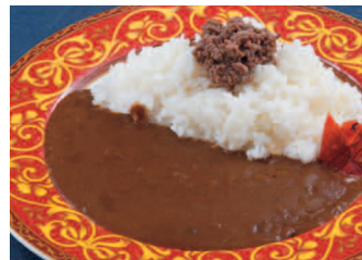
熟成ビーフカレー 850円