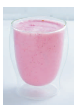
御前崎名産 いちごミルク 550円