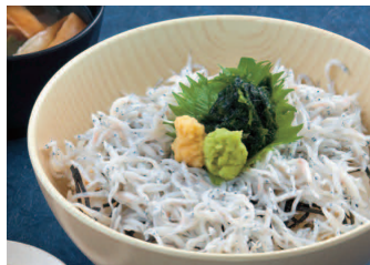
釜揚げしらす丼 980円