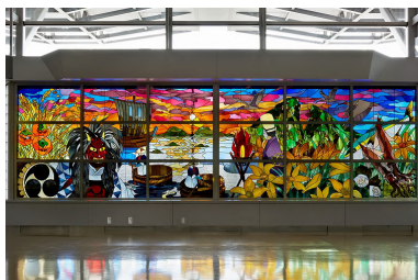
新潟空港「佐渡ものがたり」 原画・監修（2012年）