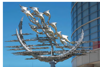
北千住駅西口駅前広場中央「乾杯」 制作（2004年）