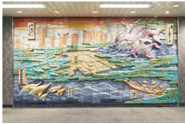
東京メトロ 豊洲駅「豊洲今昔物語」 原画・監修（2013年）