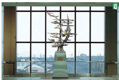
新津駅「花の道 夢の道」 制作（2003年）