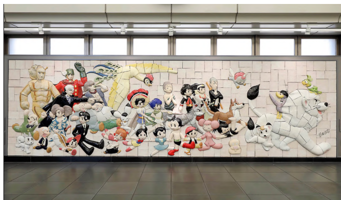
東京臨海高速鉄道 りんかい線 国際展示場駅 「Osamu Tezuka, Characters on Parade~手塚治虫キャラクターズ大行進」(2016) 原画 手塚治虫 監修 株式会社手塚プロダクション