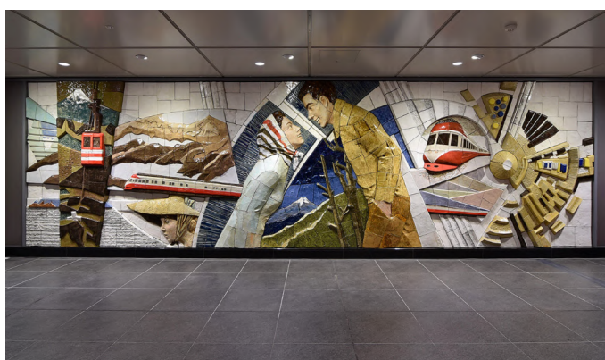
小田急線 下北沢駅(東京) 「出会いそして旅立ち」(2019年) 原画 宮永岳彦 監修 宮永辰夫、小林敬生、日高康志