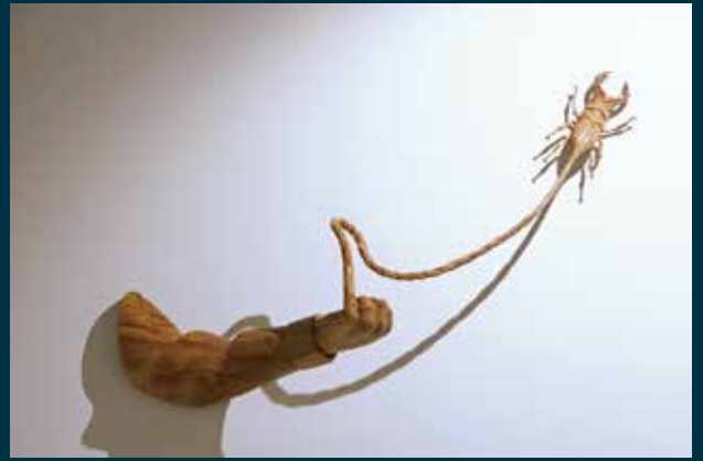
《草食男子 クワガタ》2016

本展は、屋内所蔵作品の中でも来館者に特に関心の高い《チョット休憩》(1985)を含む初期の作品から新作までを展示し、表現の連関から垣間見える黒蕨の活動の主題に触れるものとなるでしょう。