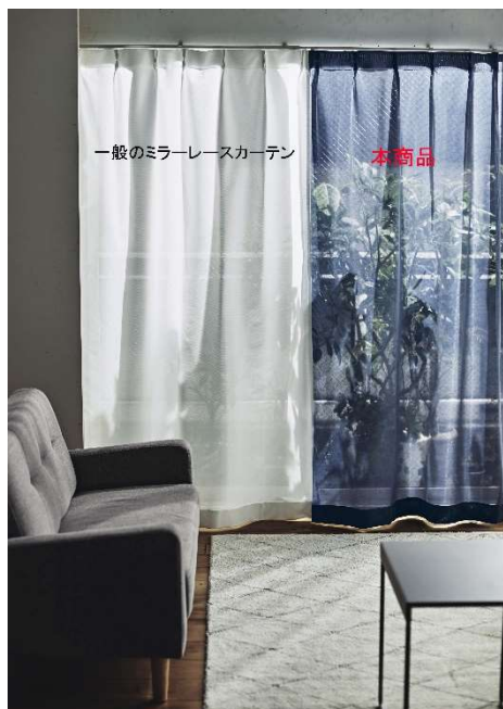
左・一般のミラーレースカーテン 右・本商品 室内からのカーテン越しの外の見え方を比較