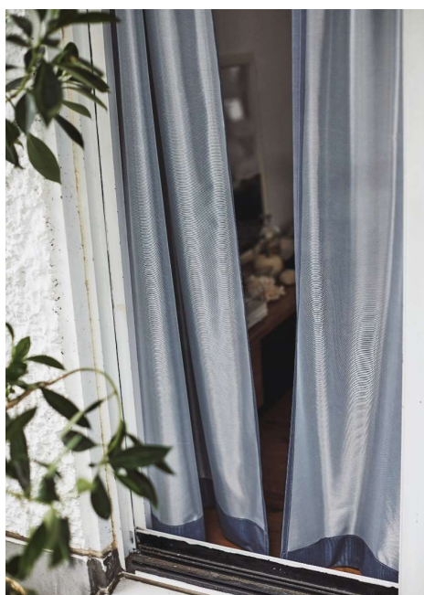
昼間は外から室内が見えにくい