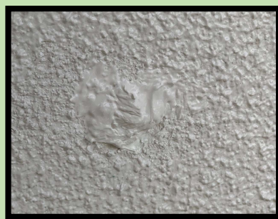
【従来のタッチアップ施工】