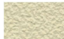
厚膜なみがた模様

様々な模様に対応・十字穴付きは施工時の調整・取り外しが可能になりました 製品は全てホワイト(アイボリー)になります