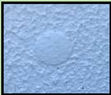
【アンカーベ:TYPE-B】 【施工例】