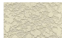
ヘッド押さえ模様