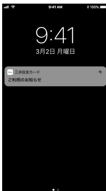
ご利用通知サービス