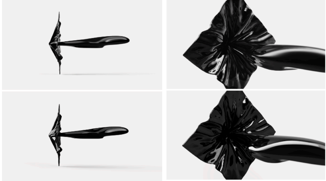
上段：漆彫刻実写 下段：3DCG

漆の質感をシミュレートしながら造形データを作成し、3Dシミュレーションの衝突実験によって、四角い布に造形物を突き刺さしたような、手わざで再現するのは困難な造形を導き出した。データは3Dプリンターで出力され、漆職人の手によって何層にもおよぶ漆塗りと研磨を施し、漆彫刻に仕上げられている。さらに、漆彫刻を3DCGのレンダリング画像の構図やライティングと同条件で撮影した。こうして撮影された写真とレンダリング画像の差異は、これまで言葉に置き換えられなかった漆の本来の魅力を実視化した。本作は伝統工芸の技術・歴史・美学をテクノロジーの視点から見つめ直すことを目的とし、漆の魅力を再解釈する「between」シリーズのひとつである。