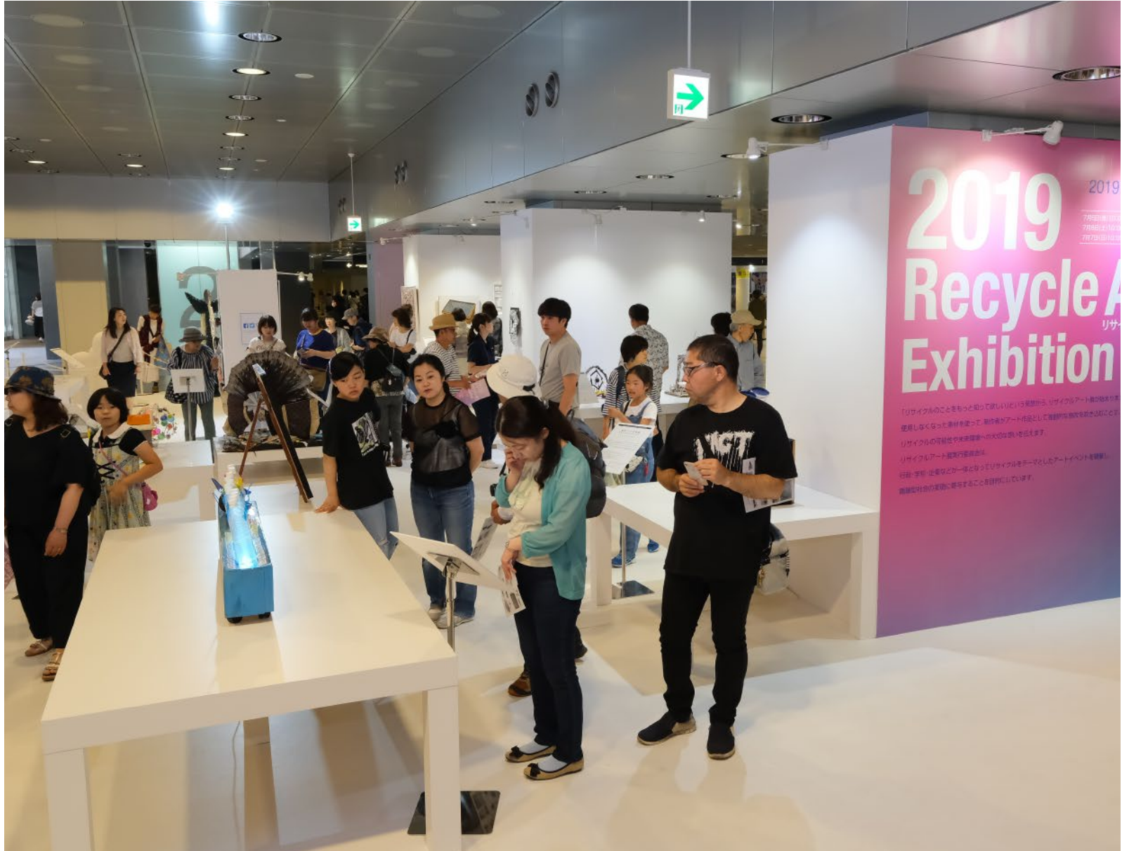
△リサイクルアート展2019