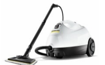
SC 2 EasyFix プレミアム