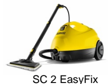
SC 2 EasyFix