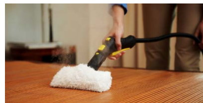
ハンドブラシにカバーを装着したイメージ