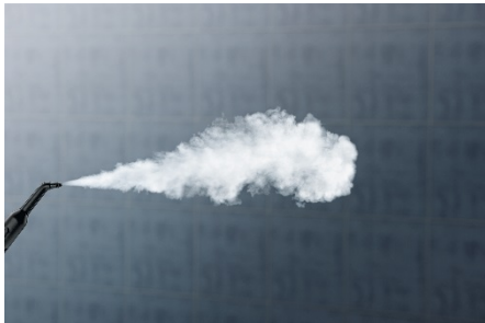
ケルヒースチーム イメージ

高い除菌力を持つケルヒースチームクリーナーは、ご家庭のみならず、免疫力の低い子供や高齢者が集まる保育園や養護施設など、衛生管理が求められる施設でも広くご利用いただいております。お客様の生活環境の向上に貢献しています。