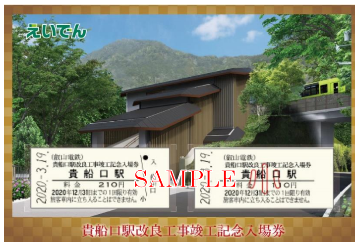
「貴船口駅改良工事竣工記念入場券」のイメージ