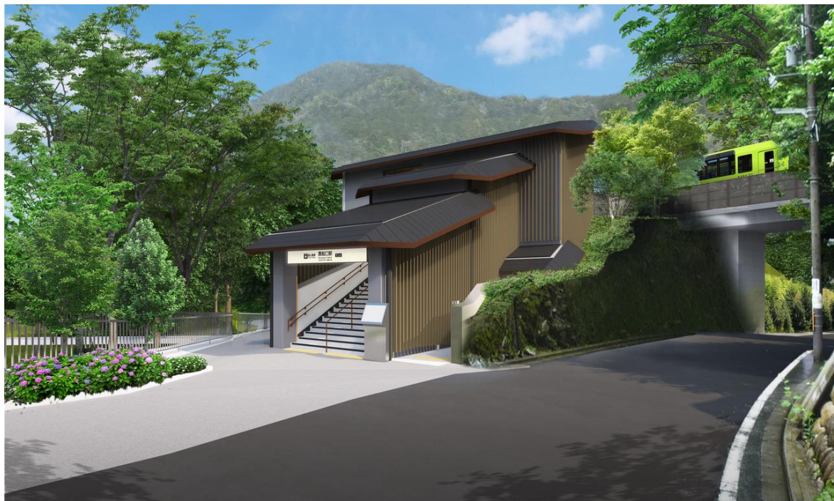
貴船口駅新駅舎のイメージ

また、改良工事の竣工を記念して同日より「貴船口駅改良工事竣工記念入場券」を発売します。詳細は別紙のとおりです。