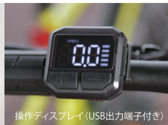
操作ディスプレイ (USB出力端子付き)