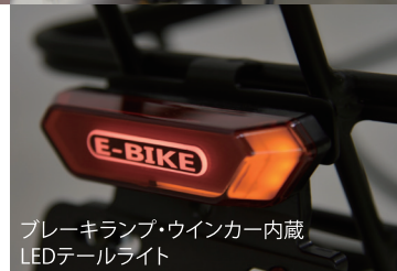
ブレーキランプ・ウインカー内蔵 LEDテールライト