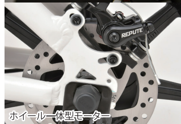
ホイール一体型モーター