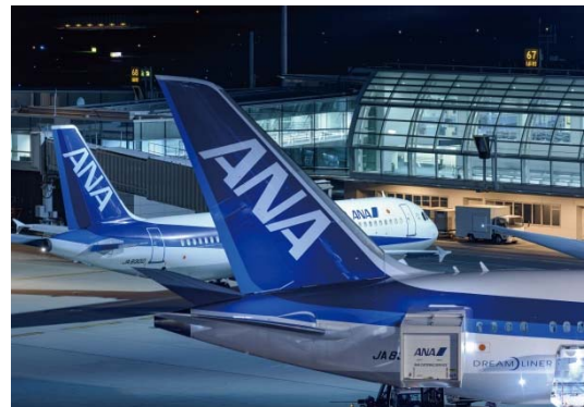
【羽田空港(東京国際空港)】