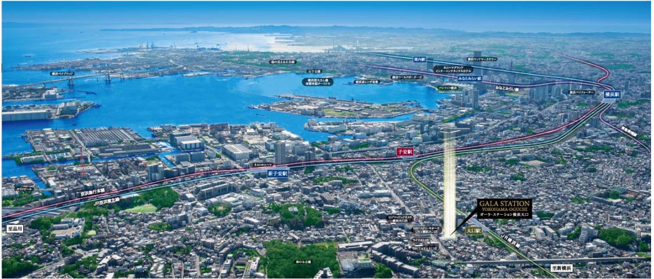
【現地上空からの航空写真】