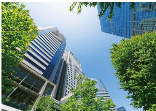
【品川インターシティ・品川グランドcommons】