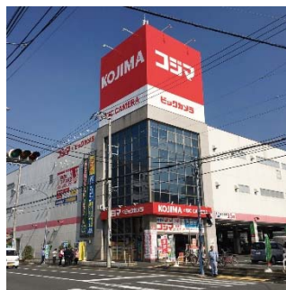
【コジマ×ビックカメラ】