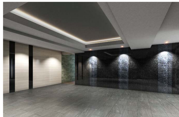
【エントランスホールイメージ】