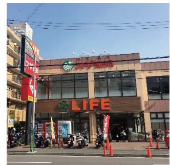
【ライフ・スギ薬局】