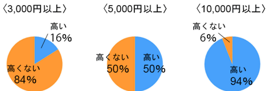
【1ヶ月のコスメ代に対する回答】

女性がすこやかに美しい肌を保つために欠かせない「コスメ」。洗顔料、化粧水、乳液など、毎日使うコスメは毎月の支出として無視できません。そこで、毎月支払うコスメ（基礎化粧品）の代金として、いくらからが「高い」と感じるかを調査しました。