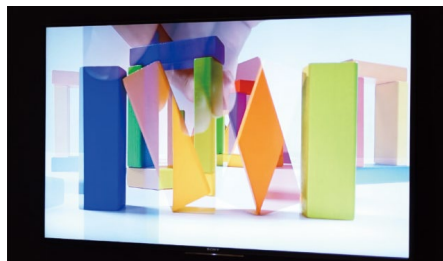
『Translucent Objects』 平瀬 ミキ 情報科学芸術大学院大学