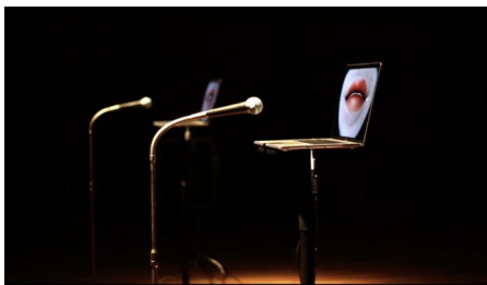
『cyack』 長嶋 海里 国立音楽大学