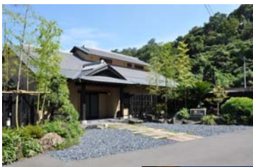
「伊東遊季亭 川奈別邸」 伊東市川奈 1385-1 0557-44-0067