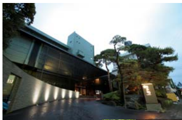
「伊東遊季亭」 伊東市宝町 1-8 0557-37-0114

FJリゾートマネジメント(株)は、「清流荘」の姉妹旅館として、他3旅館の経営も行っております。