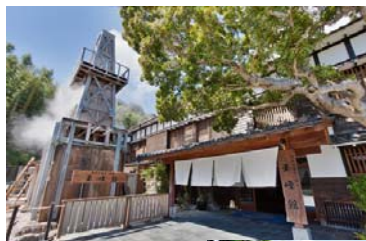
「玉峰館」 賀茂郡河津町峰 440 0558-34-2041