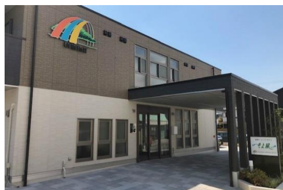
高砂ショートステイそよ風<外観>

同じく11月に開設した「高砂ショートステイそよ風」は、プライバシーに配慮した完全個室。“そよ風”の特徴でもある食事は、味や栄養のバランスはもちろん、食欲をそそる彩りにこだわり、季節を楽しむイベント食もご用意しています。浴室は車いすでも肩まで湯に浸かれる機械浴室や、プライバシーに配慮した個浴室を完備。スタッフの見守り・介助で安心・安全に入浴いただけます。季節ごとの行事やイベントなどのレクリエーションも充実し、快適にお過ごしいただける環境とサービスをご用意しています。