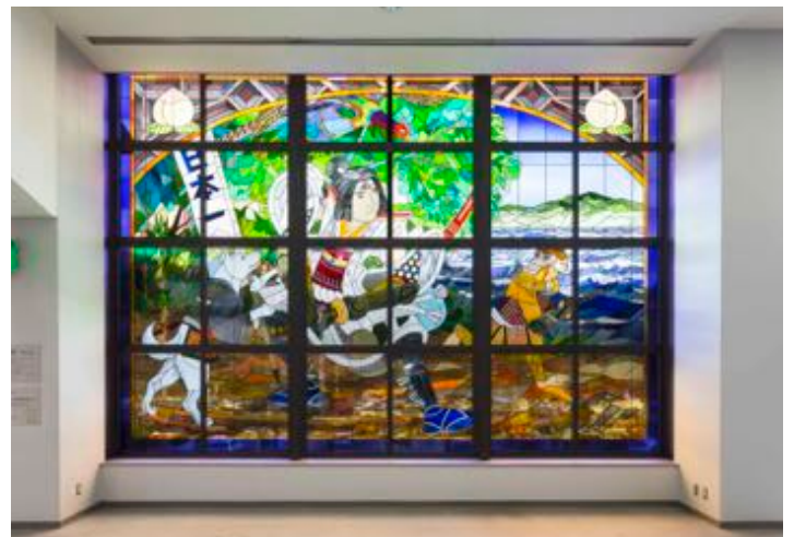
岡山空港「昔話桃太郎」（2016） 原画・監修 森山知己氏