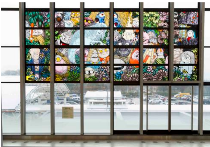
米子空港「妖怪たちの森」（2016） 原画 水木しげる氏