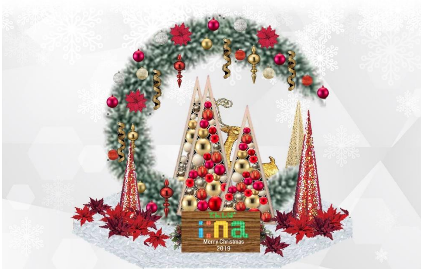
【クリスマス装飾 イメージ】

2019年11月30日(土)から2019年12月25日(水)まで、「てんしば ina (イーナ)」の中央広場に、クリスマスイメージした装飾を設置し、多くのお客さまに記念撮影を楽しんでいただけるフォトスポットとします。