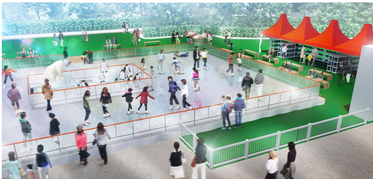
【「てんスケ」 イメージ】