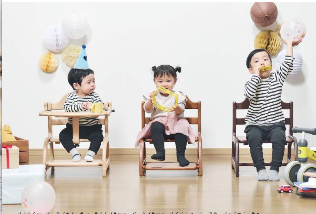
すくすくローチェア/ナチュラル、ライトブラウン、ダークブラウン すくすくローチェアテーブル/ナチュラル

0歳児から5歳児まで。 月齢、年齢に応じて使えるから、 ものをだいに使う愛着も育てます。