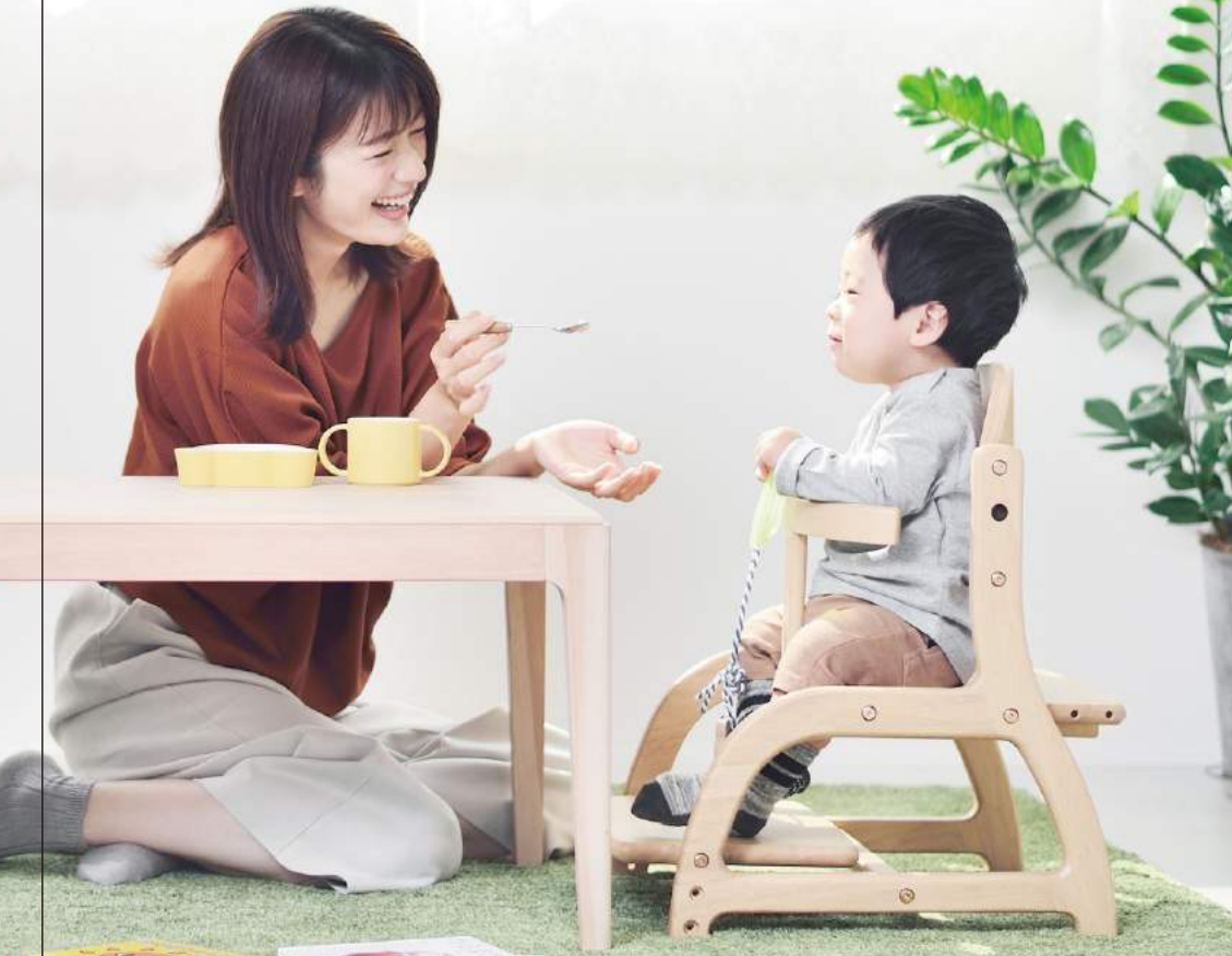
すくすくローチェア/ナチュラル

目線が合うと、安心する。 ちゃんと座れば、食事もしっかりと。 床の暮らしは、のんびりできる。