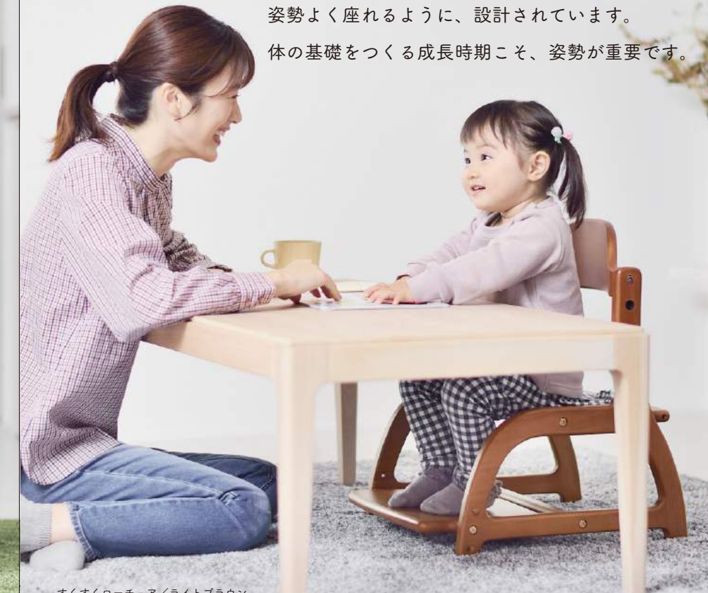
すくすくローチェア/ライトブラウン

背中が張って、足の裏がしっかりとつく。 姿勢よく座れるように、設計されています。 体の基礎をつくる成長時期こそ、姿勢が重要です。