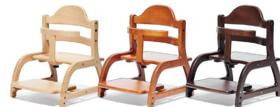
ナチュラル ライトブラウン ダークブラウン