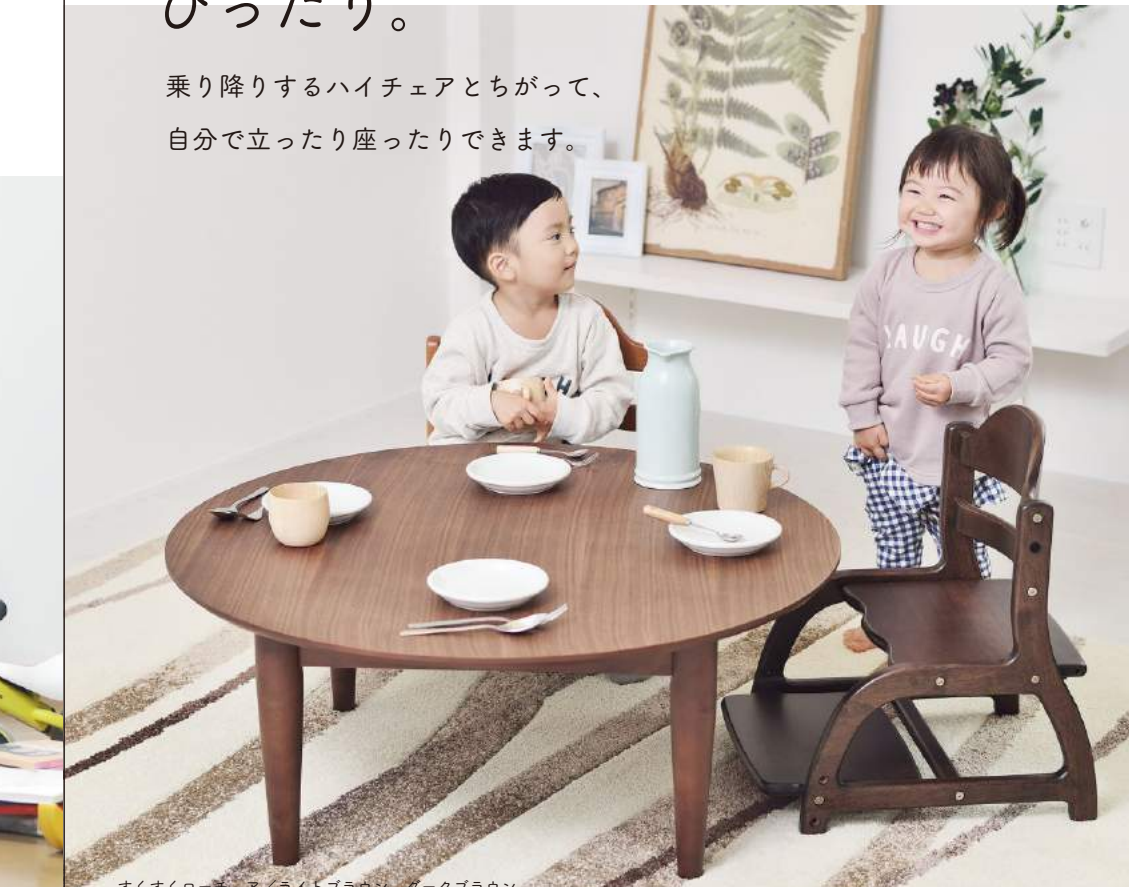
すくすくローチェア/ライトブラウン、ダークブラウン