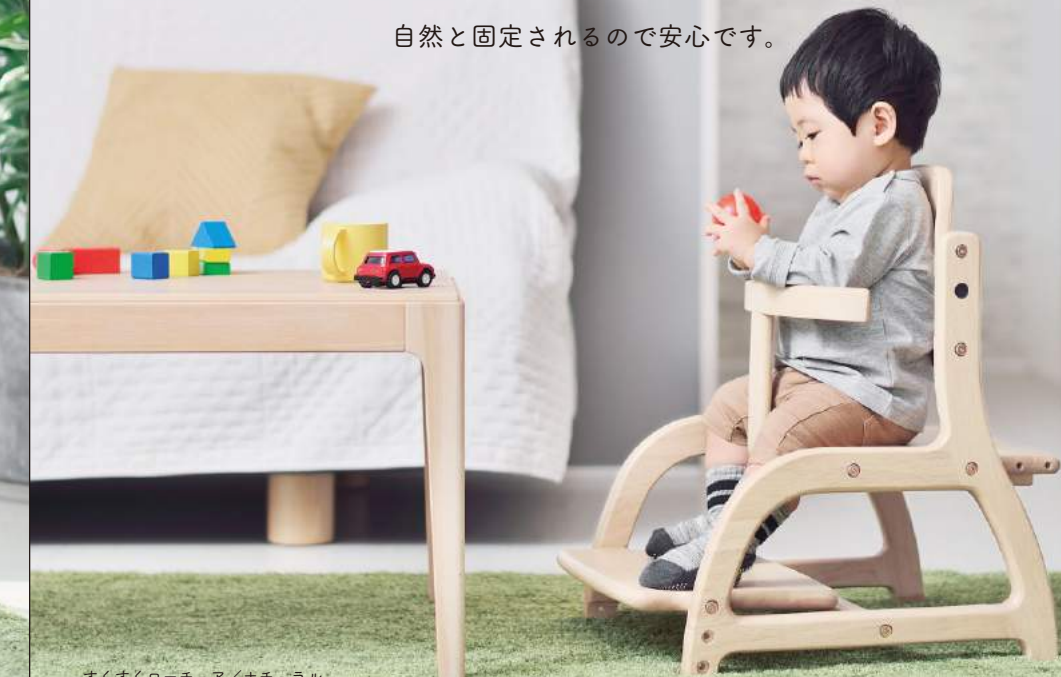
すくすくローチェア/ナチュラル

食事を用意する。食器を取りに行く。 食べ終わって片付ける。いろんな動作も気兼ねなく。 低い高さだから体ごと落ちる心配もないし、 自然と固定されるので安心です。