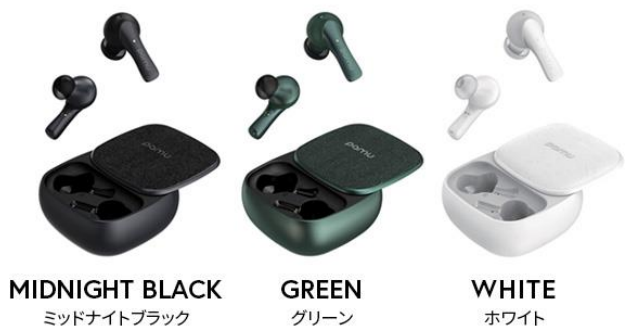
MIDNIGHT BLACK ミッドナイトブラック