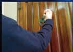
迷惑行為の証拠撮り