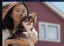
お子様やペットの見守り