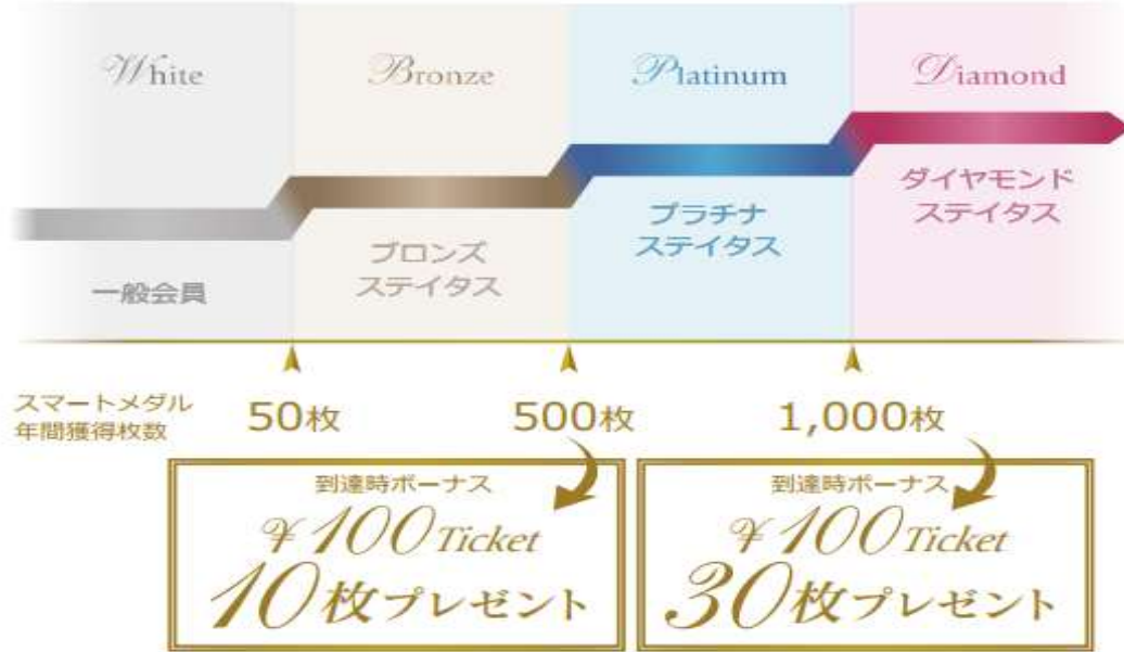
ステイタス別ご利用可能サービス一覧

クレジット決済100円＝スマートメダル2枚 現金 決済100円＝スマートメダル1枚